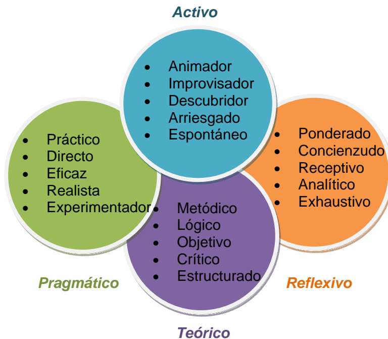
Fig.1. Características personales en los estilos de aprendizaje.

Dentro de cada tipología, podemos encontrar una serie de características personales que definen cada estilo de aprendizaje. En el siguiente gráfico podemos ver algunas de ellas: